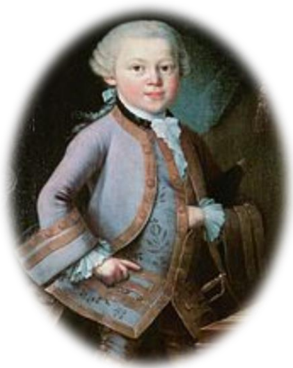
Анонимен портрет на В.А.Моцарт като дете

Забележка: Писмените отговори запиши по свое желание/в тетрадката по БЕЛ литература или на постер. Най-активно включващите се в четенето и обсъждането ще получат отлична оценка.